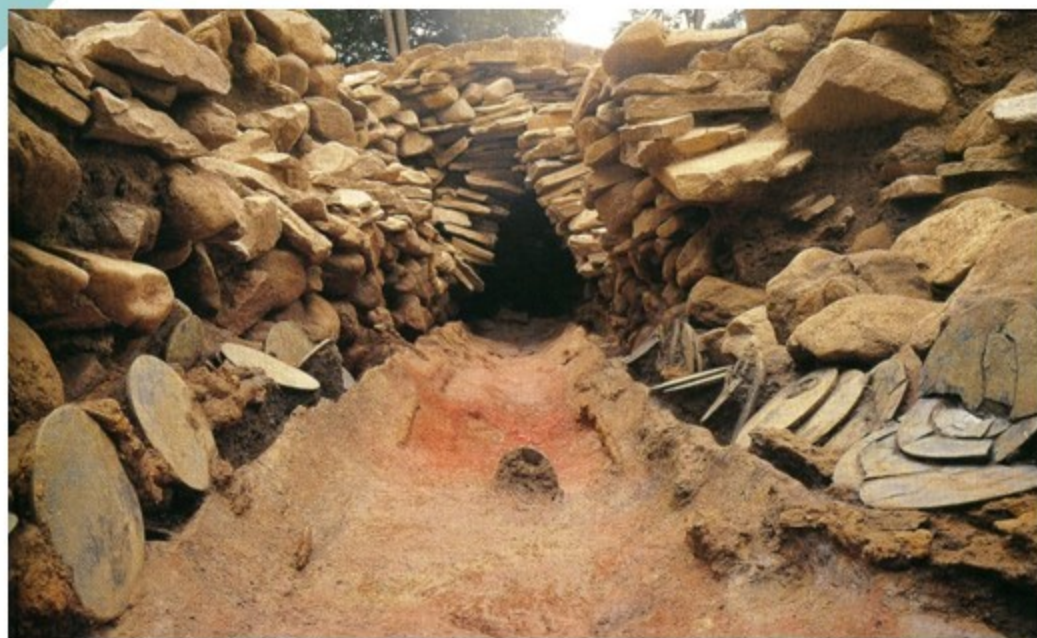
奈良県黒塚古墳 三角縁神獸鏡33面