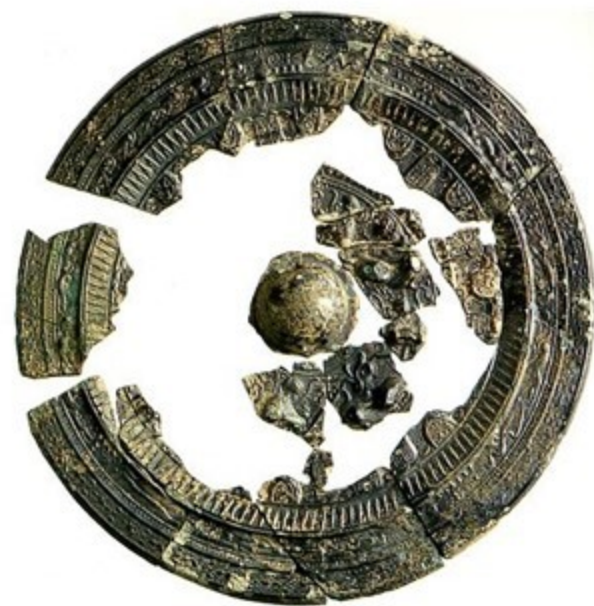
徳島県萩原1号墳墓 画紋帯同向式神獸鏡