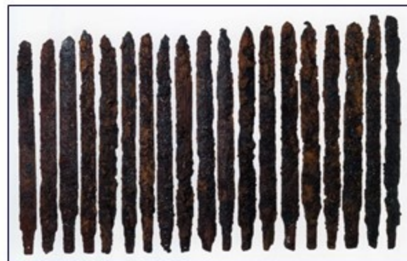
鉄製武器・儀器の大量副葬／メスリ山古墳