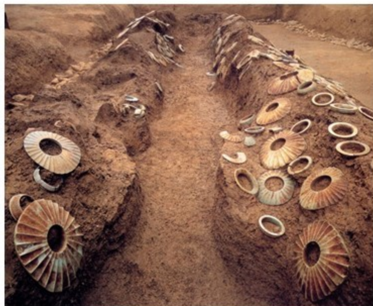
奈良県島の山古墳 腕輪型石製品133点