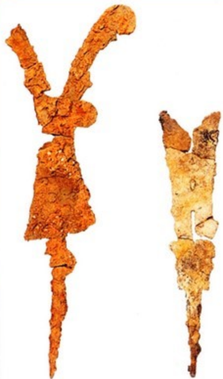
82-1 鉄の儀杖／ 奈良県黒塚古墳