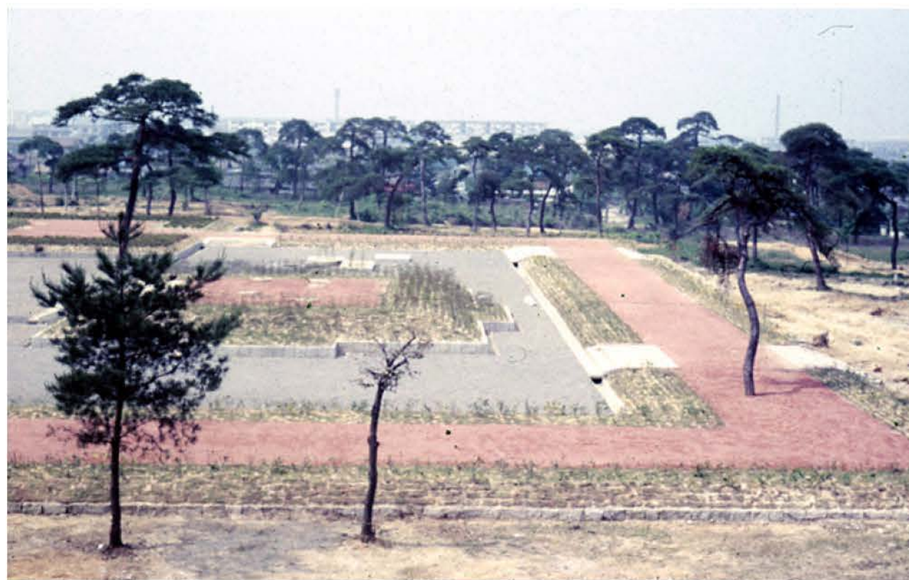
1965年整備直後の東塔と伽藍地東半(南から)