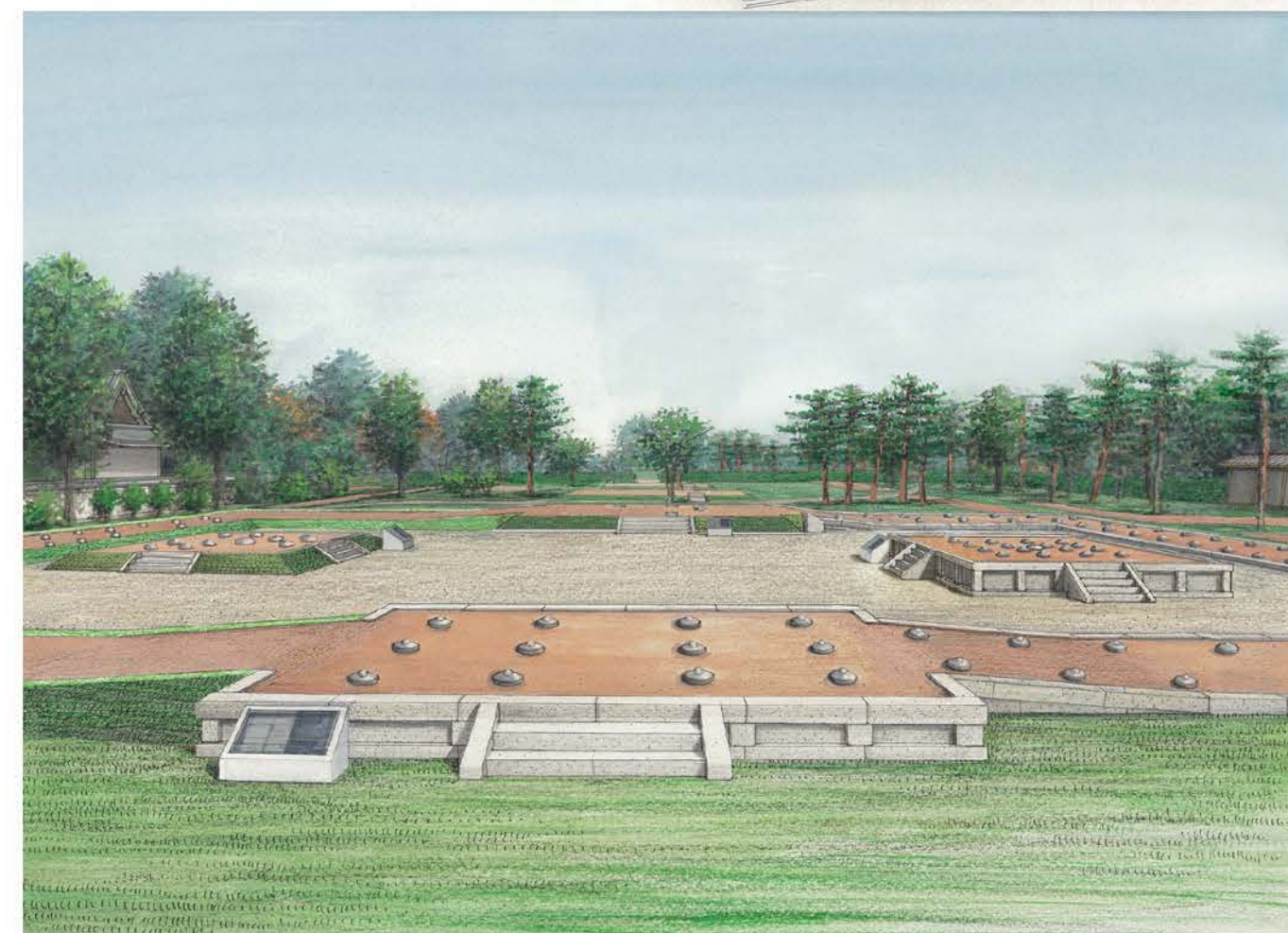
中門手前から伽藍地を望む