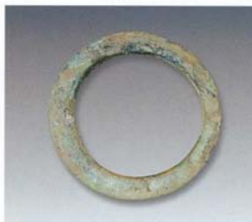
6. 环 (SDM1:5)