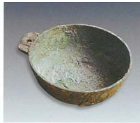
2. 单耳杯 (SDM1:3)