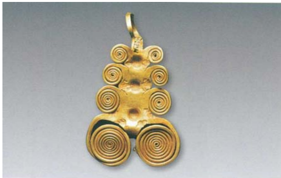
1. 花饰 (SDM1:9)