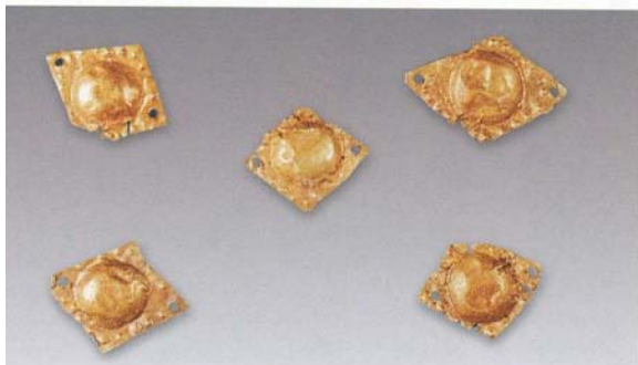
2. 泡饰 (SDM8:3)