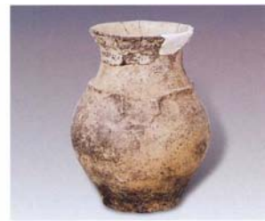
2. 夹砂壶 (SDM6:4)