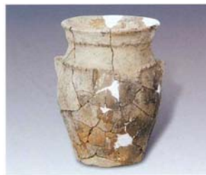
1. 夹砂侈口罐 (SDM6:3)