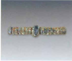
3. 连珠形管状饰 (SDM1:6)