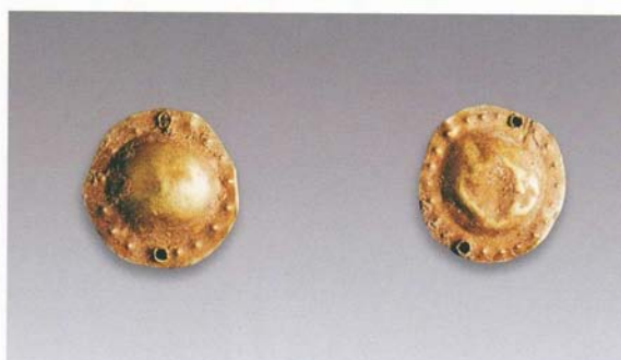
4. 泡饰 (SDM1:10, SDM1:20) (左→右)