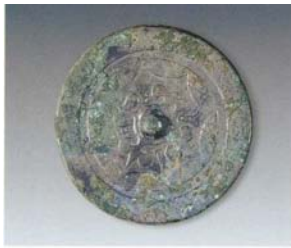
1. “长宜子孙”镜 (SDM12:1)