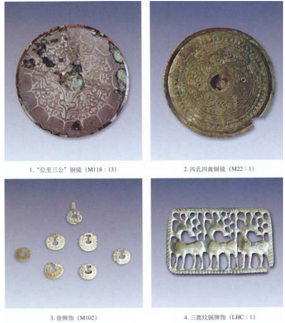
1. “位至三公”铜镜 (MI18:13)