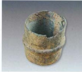
4. 铜镞 (SDM4:1)