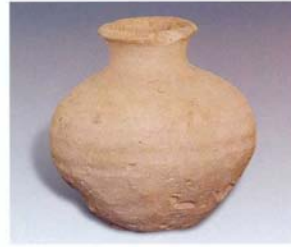
3. 泥质鼓腹罐 (SDM12:8)