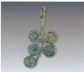
5. 耳饰 (SDM8:2)