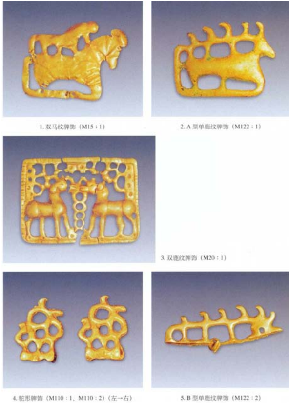
1. 双马纹牌饰 (MI5:1)