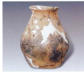
4. 夹砂壶 (SDM7:4)