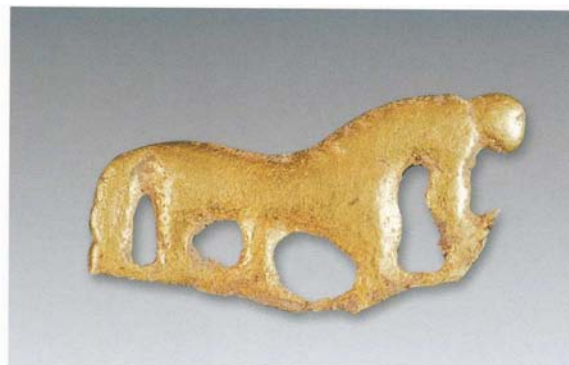
3. 双马纹牌饰 (SDM4:5)