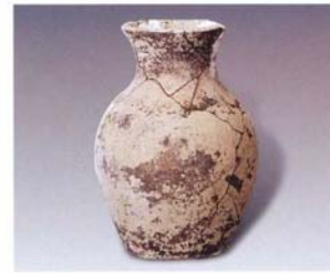
5. 夹砂壶 (SDM17:5)